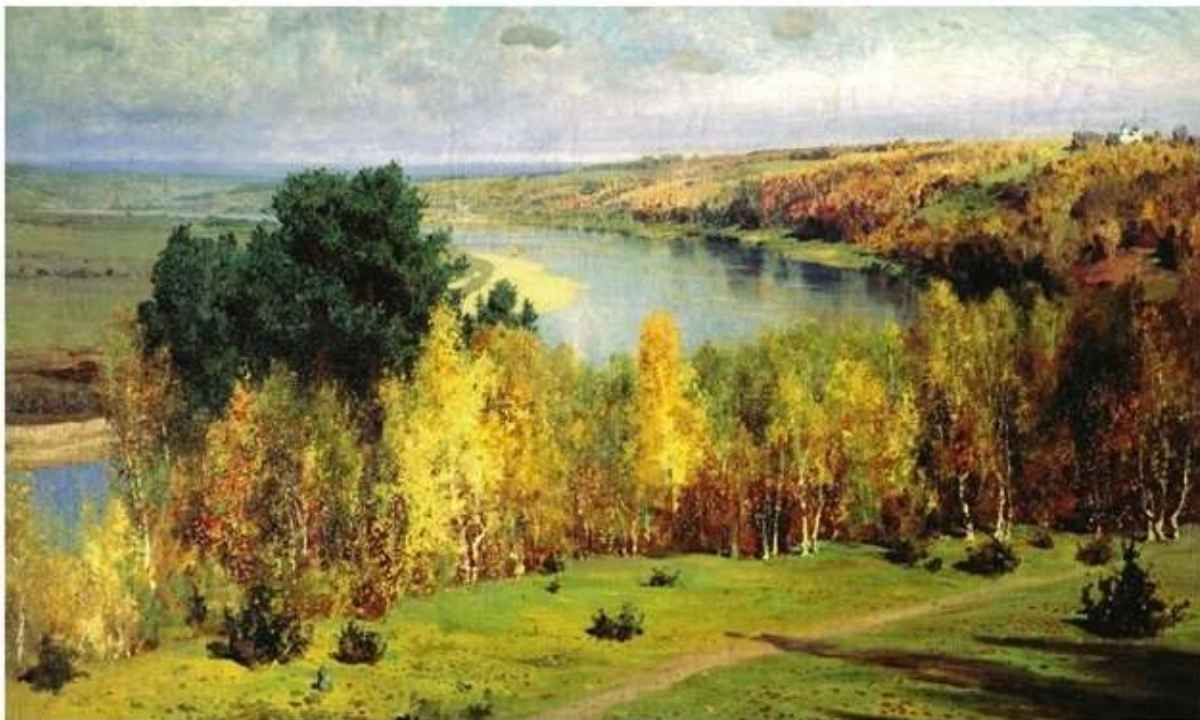
В. Д. Поленов. Золотая осень

Наступила осень. В саду собирали плоды — румяные яблоки и жёлтые груши. Митя был в восторге и говорил отцу: