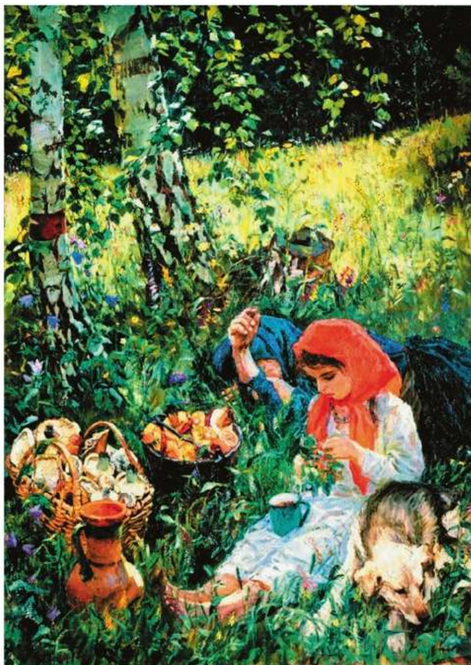
А. А. Пластов. Летом

Настало лето. Митя с отцом отправились на сенокос. Весь длинный день веселился мальчик: ловил рыбу, набрал ягод, кувыркался в душистом сене, а вечером сказал отцу: