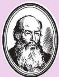
Афанасий Афанасьевич Фет

Будем наблюдать за художественными приёмами, которые использует поэт.