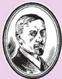
Иван Алексеевич Бунин

Будем стараться понимать настроение поэта.