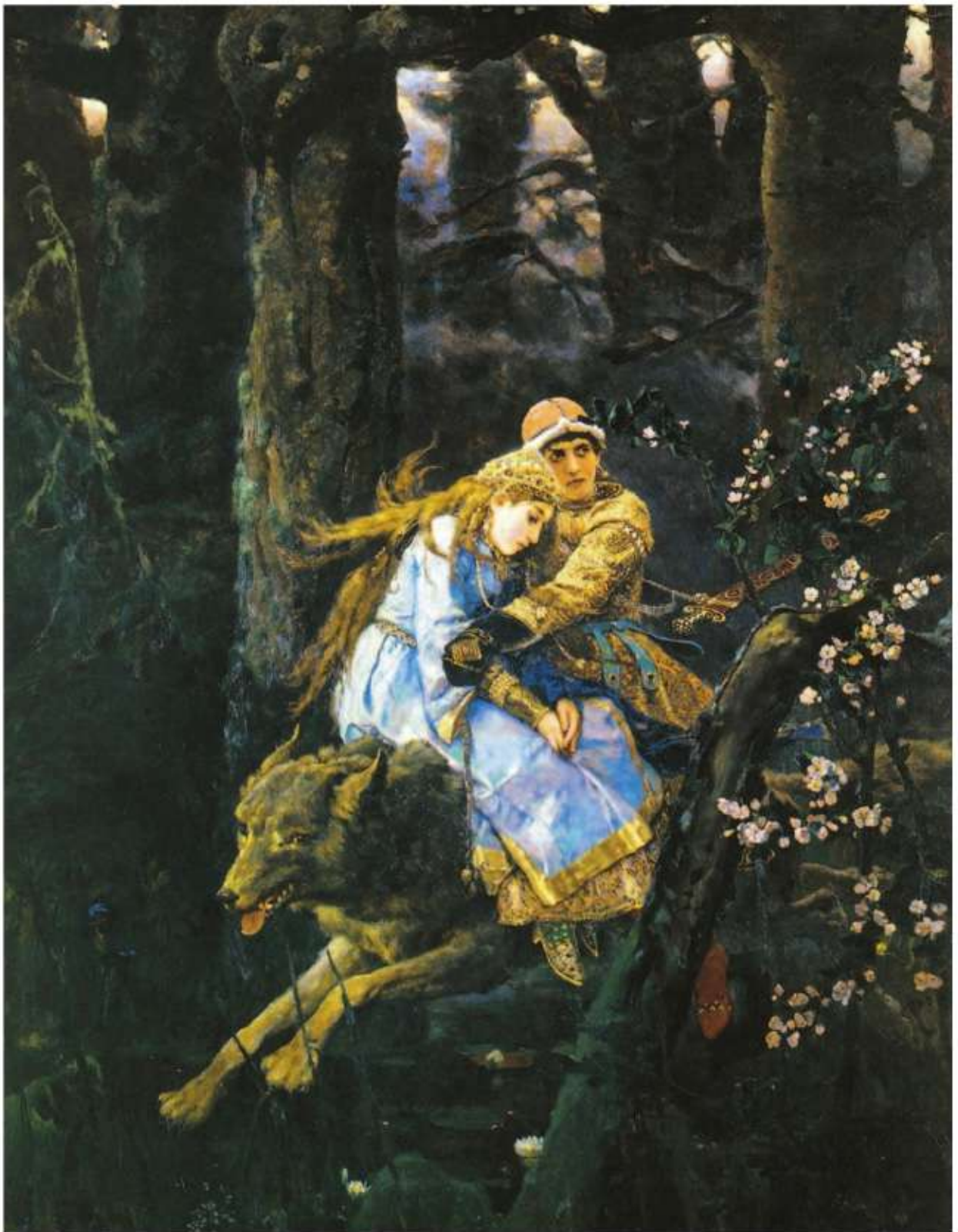
В. М. Васнецов. Иван Царевич на Сером волке (к упр. 138, с. 77)