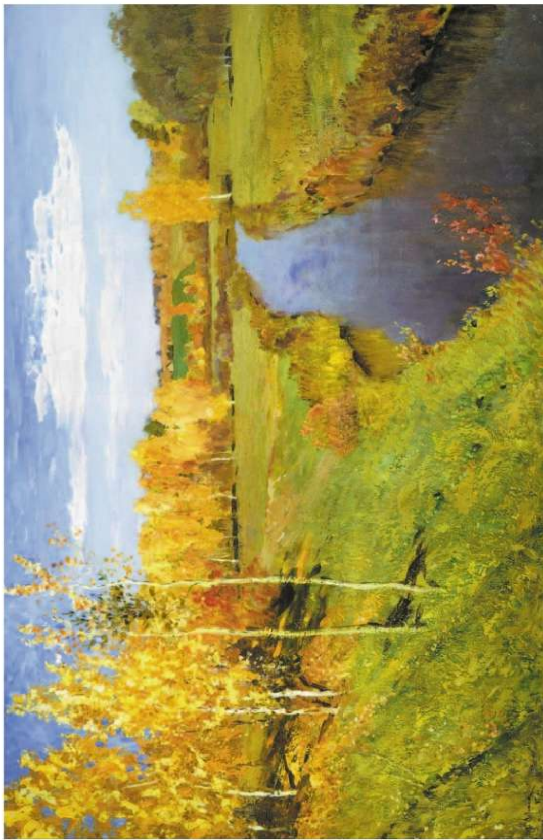
И. И. Левитан. Золотая осень (к упр. 48, с. 32)