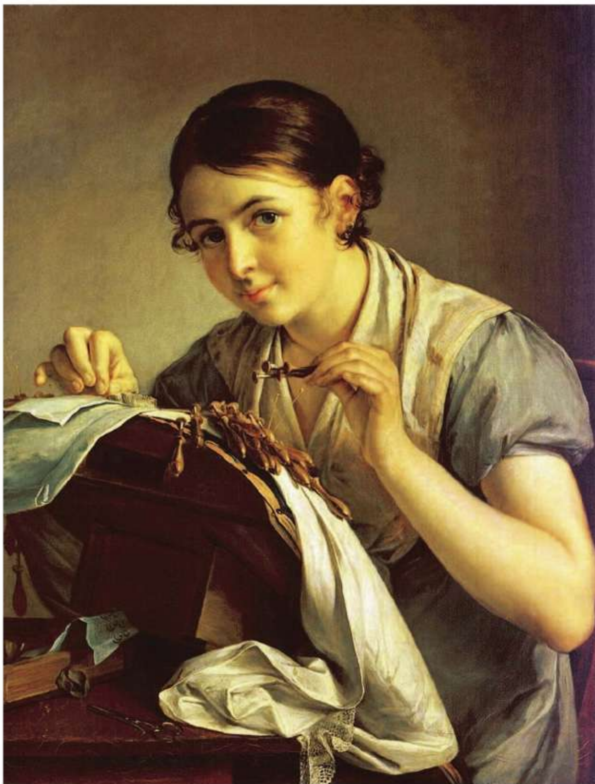
В. А. Тропинин. Кружевница (к упр. 249, с. 128)