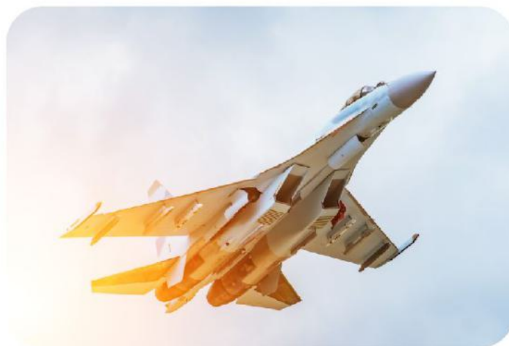
Военно-воздушные силы (ВВС)